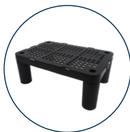
Imagen producto completo