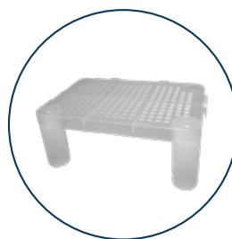
Imagen producto completo